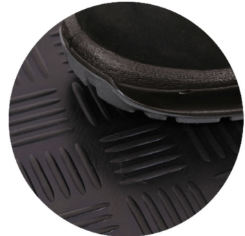
G1305 Hammerschlagmatte schwarz