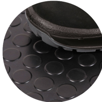
G1304 Flachnoppenmatte schwarz