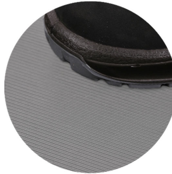
G1301 Feinriefenmatte grau