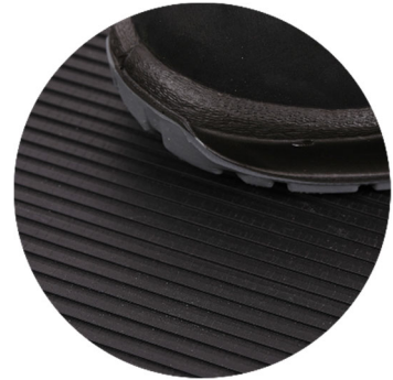
G1302 Breitriefenmatte schwarz